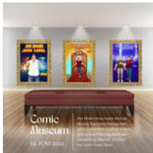
Am 19.06.2024: Der Heiler im Comic-Museum