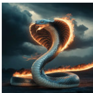
Verleugne nicht deine Natur